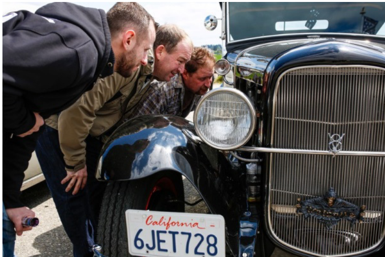
Was das Männerherz begehrt.